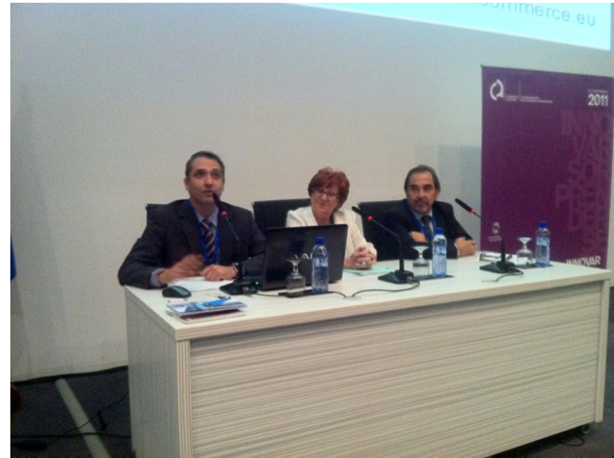
VIII Encuentro Ciudades Comerciales Alicante 29 Septiembre 2011