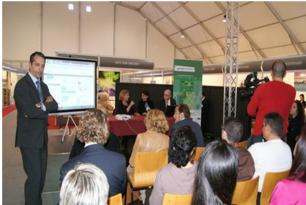
Expo Torrevieja Business 30 Marzo 2011