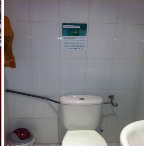
Consumo y Ahorro de Agua