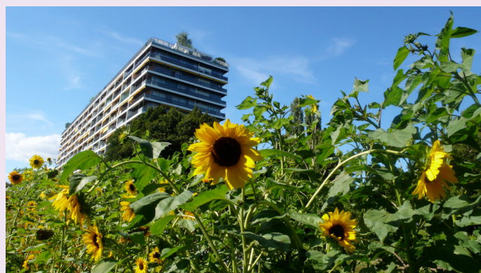
La ferme de Budé: un exemple d'agriculture urbaine en ville de Genève.